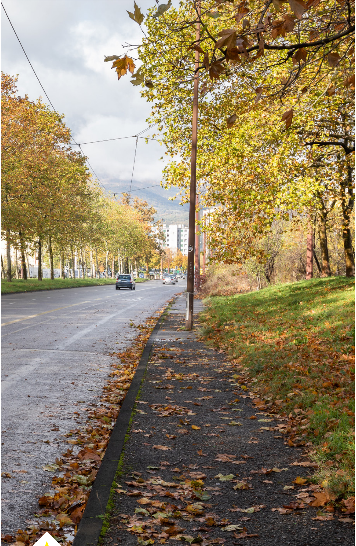
L'avenue Edmond Esmonin en bordure de la friche